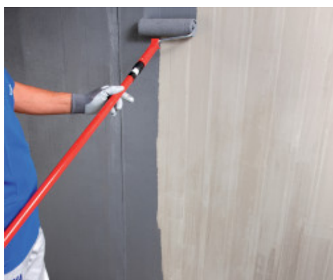
Aplicación de Eco Prim Grip Plus a rodillo sobre soporte de hormigón

Cuando se utilice como promotor de adhesión para alisados cementosos sobre soportes tratados con imprimadores epoxídicos o poliuretánicos (como Primer MF , Primer MF EC Plus , Eco Prim PU 1k , Eco Prim PU 1k Turbo ) sobre los cuales no se haya esparcido árido, Eco Prim Grip Plus deberá aplicarse puro después de completo secado y no antes de 24 horas desde la aplicación del mencionado imprimador. Este tipo de aplicación se admite en el caso de nivelaciones no superiores a 10 mm y cuando no esté prevista la colocación de madera maciza tradicional.