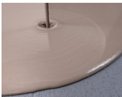
Aplicación de enlucido autonivelante sobre Eco Prim Grip Plus seco y aplicado sobre viejo pavimento