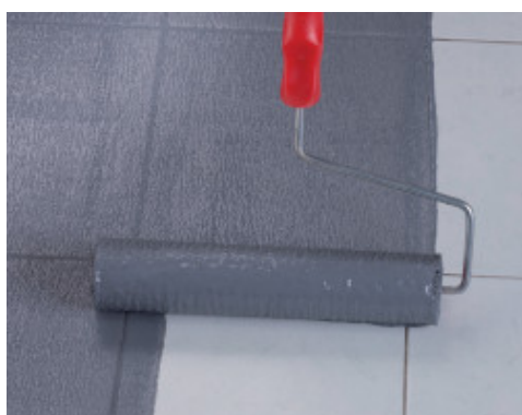
Aplicación a rodillo de Eco Prim Grip Plus sobre pavimento existente de losetas de gres porcelánico